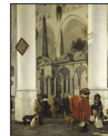
Intérieur de la Nieuwe Kerk de Delft. Emmanuel de Witte