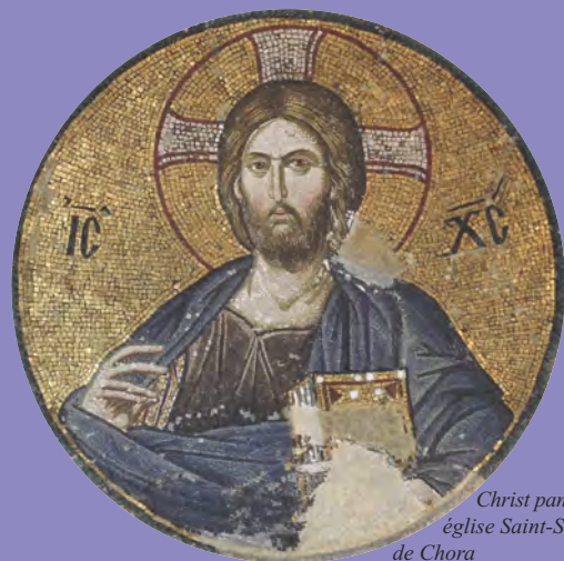
Christ pantocrator, église Saint-Sauveur de Chora

HALL DU CENTRE MALESHERBES-SORBONNE vendredi 23 et samedi 24 janvier 2015 10H - 20H