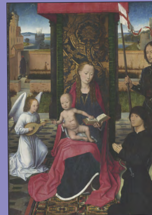
Vierge à l'Enfant avec un ange, saint Georges et un donateur. Hans Memling

VENDREDI 23 ET SAMEDI 24 JANVIER 2015 10H- 20H Centre Malesherbes - Sorbonne