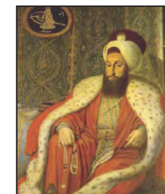
Sultan Selim III. Konstantin Kapidagli Istanbul, Turquie