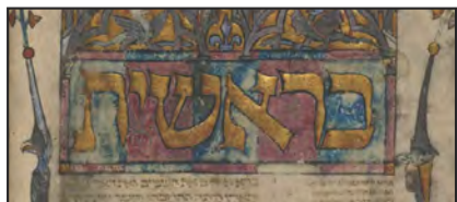
Bible de Kennicott