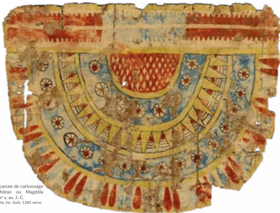
Élément d'une parure de cartonnage de momie Ghôran ou Magdôla (Fayoum) ? ; III e /IV e s. av. J.-C. Sorbonne Université, inv. Sorb. 1385 verso

retrace son expansion au gré d'une pérégrination qui va du pays de Cléopâtre à celui de Clovis. Grâce à une sélection d'une cinquantaine de pièces hors du commun, le visiteur voyagera de l'Égypte gréco-romaine jusqu'à la France mérovingienne en passant par le Levant hellénisé, Constantinople et l'Italie romaine, byzantine et médiévale. Il pourra admirer des documents et des livres exhumés des sables d'Égypte, des rouleaux de la fameuse bibliothèque d'Herculanum ayant survécu à l'éruption du Vésuve, des chartes de la chancellerie mérovingienne arborant les précieux autographes de Dagobert, de Saint Éloi ou de Clovis II, des ordres d'empereurs byzantins et des bulles papales... et même un pseudo-testament de César qui provient de Ravenne. Ces précieux documents sont écrits dans les multiples langues utilisées tout autour de la Méditerranée (égyptien, grec, latin, arabe, hébreu, etc.) et illustrent la vie des Anciens dans tous les domaines (intellectuels, religieux, économiques, artistiques, etc.).