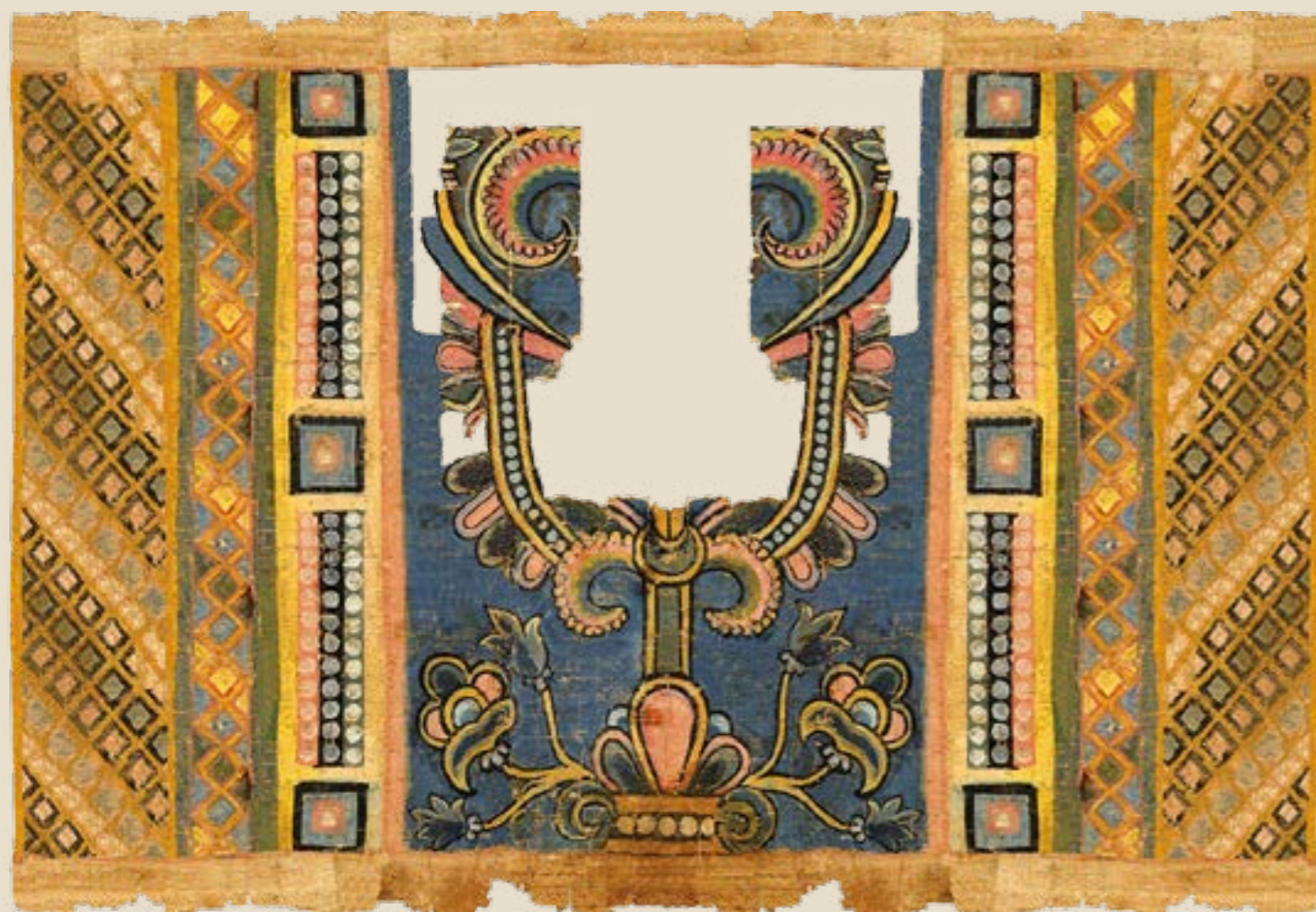
Modèle de tisserand ou de mosaïste Sorbonne Université